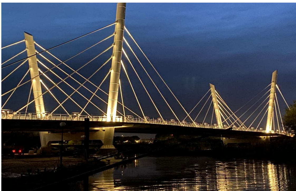
Ponte “Filomena Delli Castelli” 2019 - Pescara